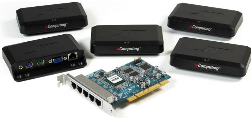
X550 Paket mit fünf Zugriffsgeräten

Die installierte vSpace™ Desktop Virtualisierungs-Software stellt auf den Zugriffsgeräten einen virtualisierten Desktop (Windows oder Linux) mit Zugriff auf alle installierten Software-Programme, Netzwerkressourcen und USB-Schnittstellen zur Verfügung. Jedem Nutzer wird ein vollwertiger Windows- oder Linuxarbeitsplatz inklusive Multimedia, Audio und Vollbild-Video mit einer Auflösung von bis zu 1280x1024 bzw. 1440x900 (Breitbildformat) geboten. NComputing bietet eine volle Multimedia-Unterstützung. Eine Stromversorgung der Zugriffsgeräte ist nicht notwendig - diese erfolgt über die Netzkabel.