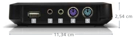
SEITENANSICHT DER L230